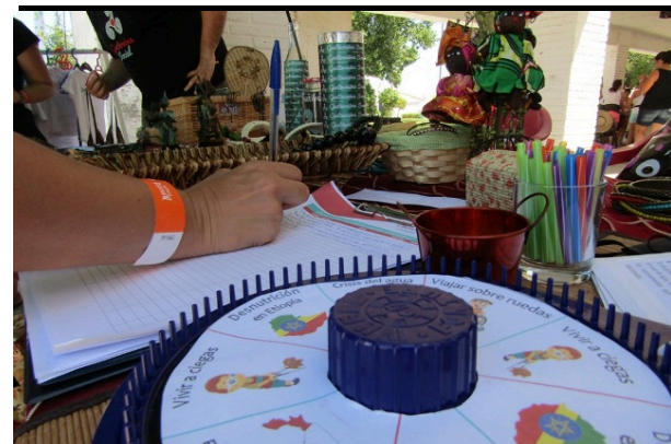
Talleres de salud y empatía