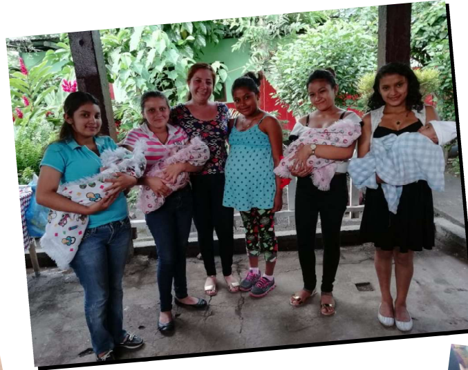
“Una vida a la vez”, atención a niñas embarazadas en Nicaragua ”