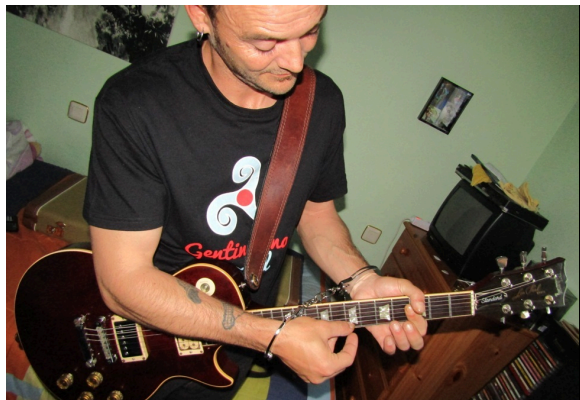
Campañas en colegios y en RRSS