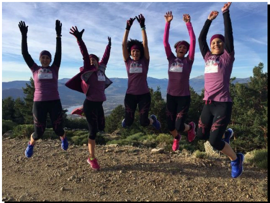
Visibilidad de ejemplos positivos y fomento de la autonomía