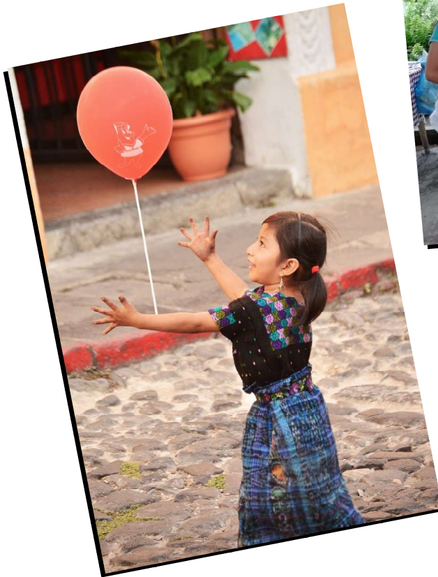
“Educación contra la violencia en el estado de Sinaloa, México ”