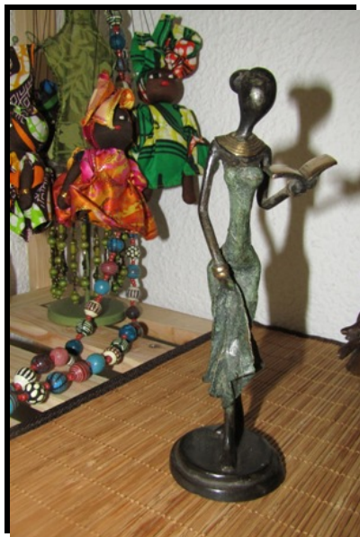
Fomento del comercio justo y venta de artesanía