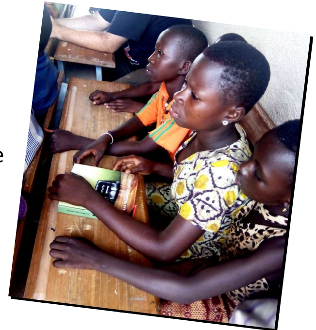
“Educación y emprendimiento rural en aldeas de Burkina Faso ”