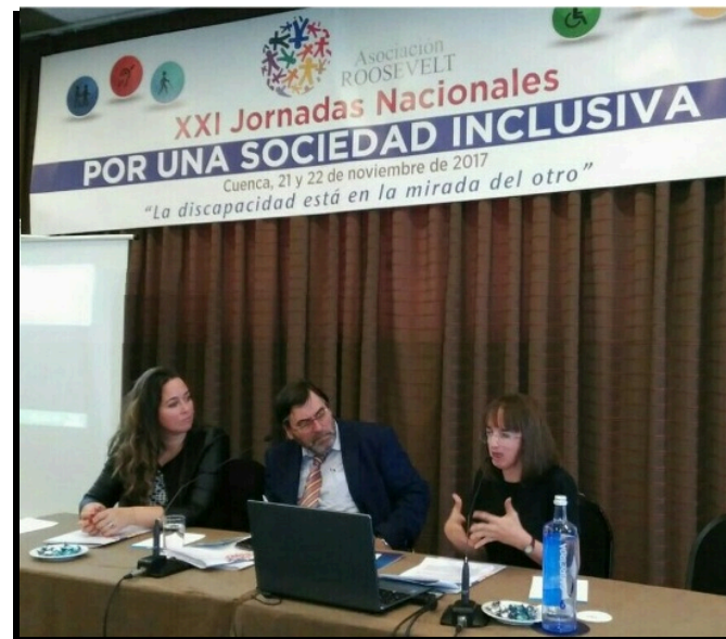
Participación en Jornadas nacionales y seminarios